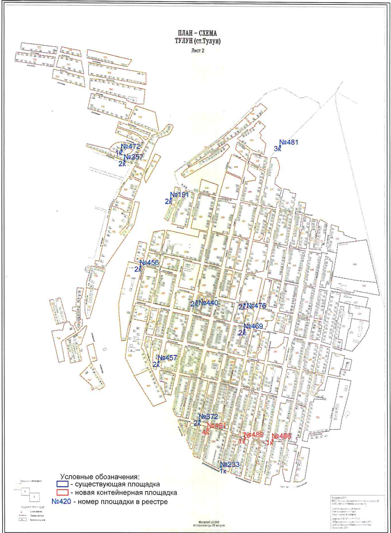
СХЕМА РАЗМЕЩЕНИЯ МЕСТ (ПЛОЩАДОК) НАКОПЛЕНИЯ ТВЁРДЫХ КОММУНАЛЬНЫХ ОТХОДОВ НА ТЕРРИТОРИИ МУНИЦИПАЛЬНОГО ОБРАЗОВАНИЯ - "ГОРОД ТУЛУН"