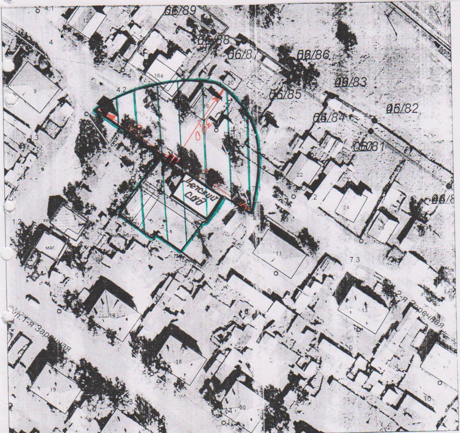
Схема границ прилегающей к муниципальному бюджетному дошкольному образовательному учреждению города Тулуна «Детский сад «Колобок» территории, на которой не допускается розничная продажа алкогольной продукции ул. 2-я Заречная, 9 М 1:1000

Приложение № 10 к постановлению администрации городского округа от 29.03 2013 г. № 627