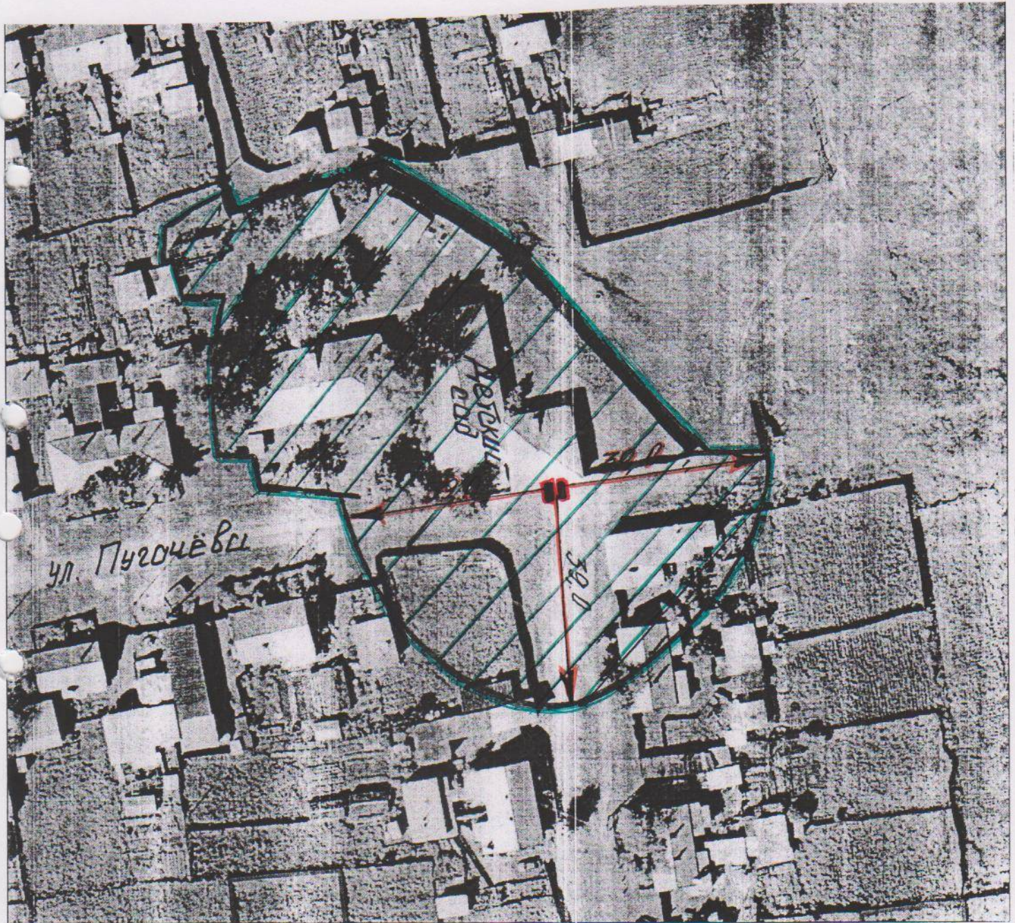
Схема границ прилегающей к муниципальному бюджетному дошкольному образовательному учреждению города Тулуна «Детский сад « Мальвина» территории, на которой не допускается розничная продажа алкогольной продукции ул. Пугачева, дом №2 М 1:1000