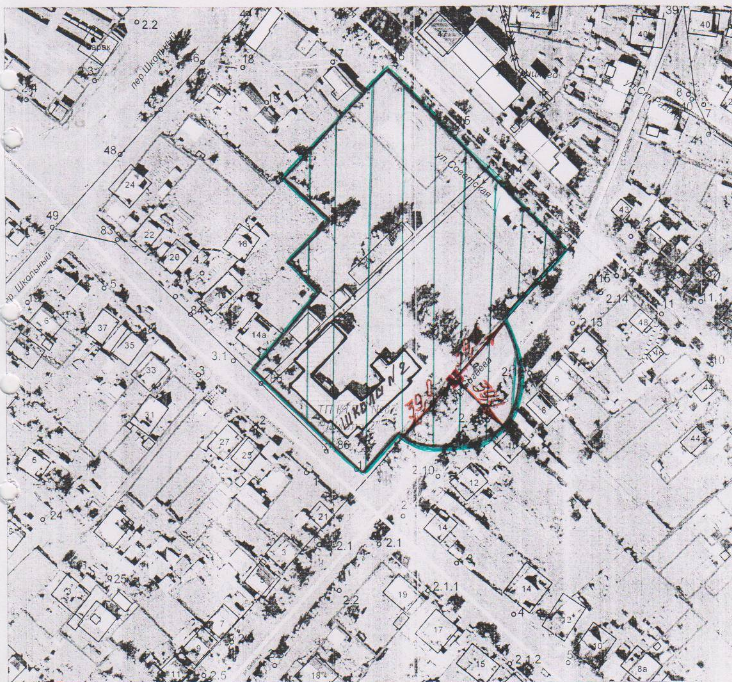
Схема границ прилегающей к муниципальному бюджетному образовательному учреждению города Тулуна «Средняя общеобразовательная школа № 2» территории, на которой не допускается розничная продажа алкогольной продукции ул. Сигаева, д. 3 М 1:2000