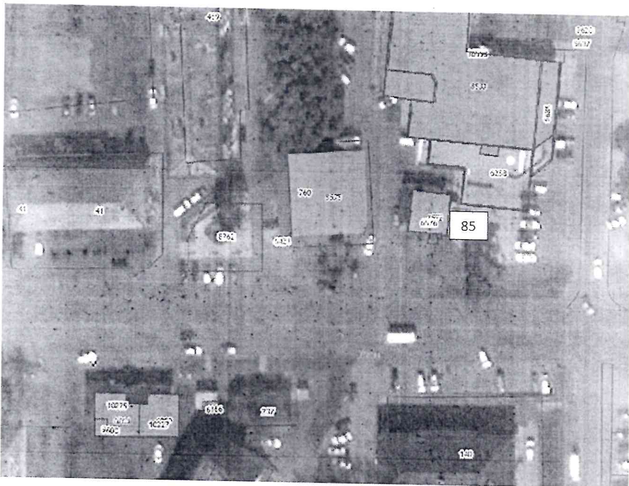
Координаты границ земельного участка № 85

Графическая схема размещения нестационарных торговых объектов на территории муниципального образования – «город Тулун» по адресу: Иркутская область, г.Тулун, мкр. Угольчиков, 38а (рядом с магазином «Елена»), согласно приложению № 1