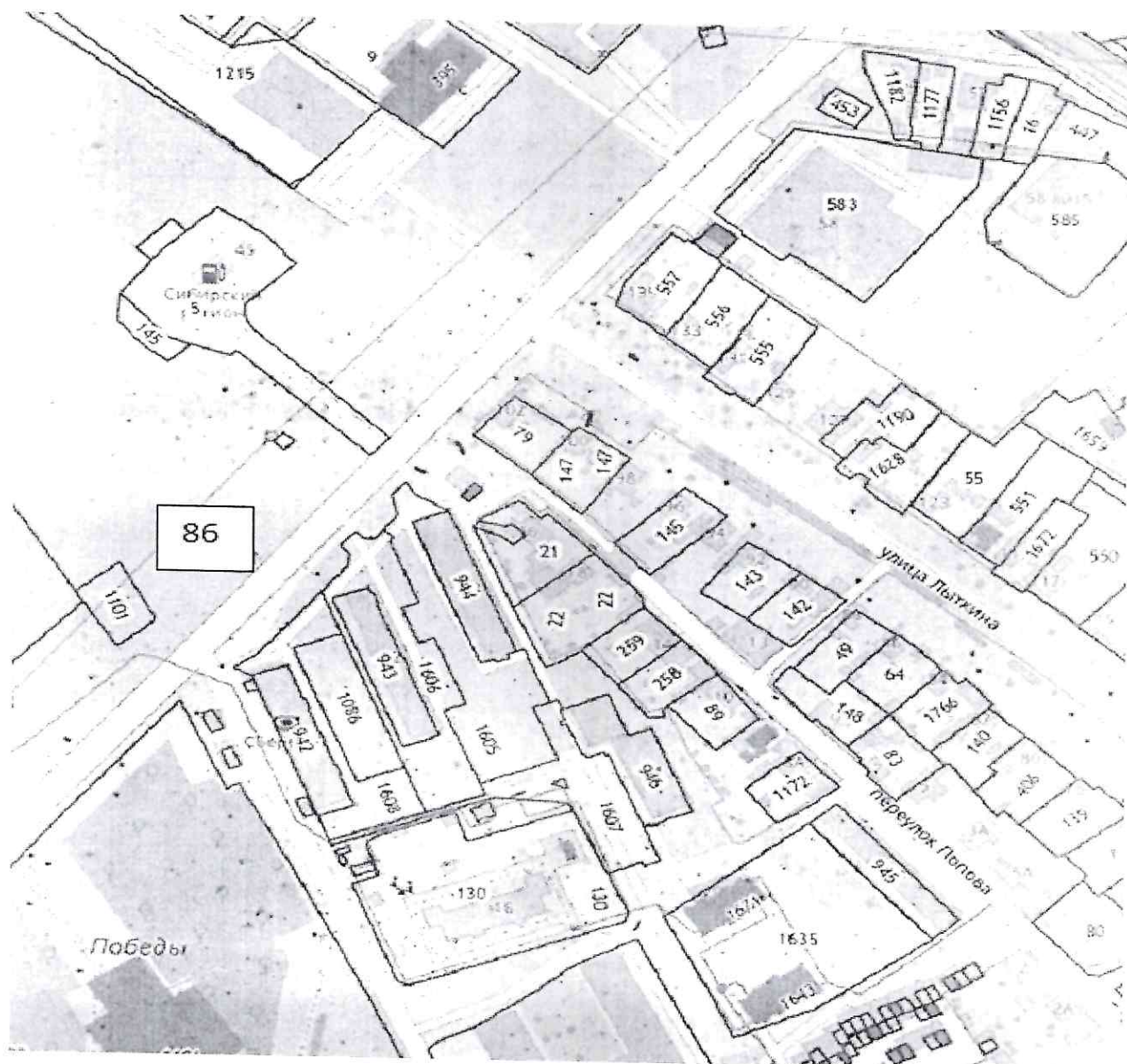
Координаты границ земельного участка № 86

Графическая схема размещения нестационарных торговых объектов на территории муниципального образования – «город Тулун» по адресу: Иркутская область, г.Тулун, пос. Стекольный, 65в (около остановки), согласно приложению № 1