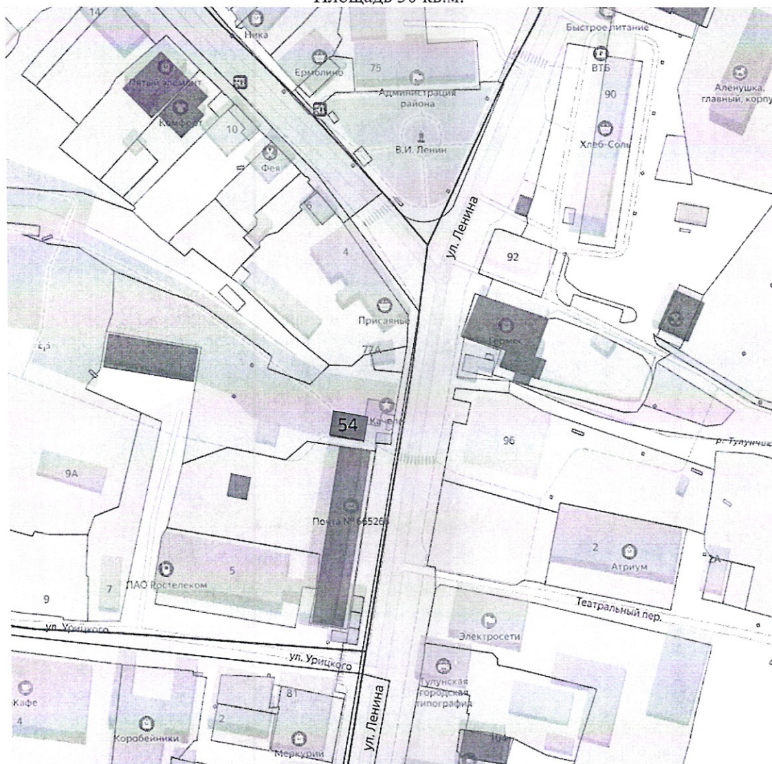
Схема расположения нестационарного торгового объекта На территории муниципального образования – «город Тулун» по адресу: Иркутская область, г. Тулун, ул. Ленина (рядом с входной группой парка «Тулунчик») Площадь 30 кв.м.

Приложение № 54 к постановлению администрации городского округа «город Тулун» от 08.11.2022г. № 1791