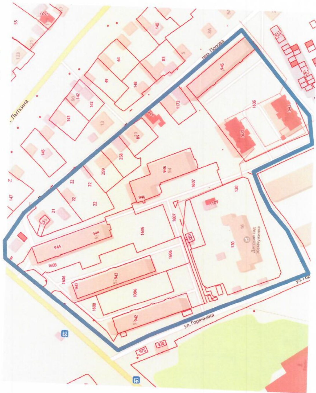
Схема границ территории для подготовки документации по планировке территории пос. Стекольный

Приложение № 3 к постановлению администрации городского округа от 25 сентября 2022 года № 527