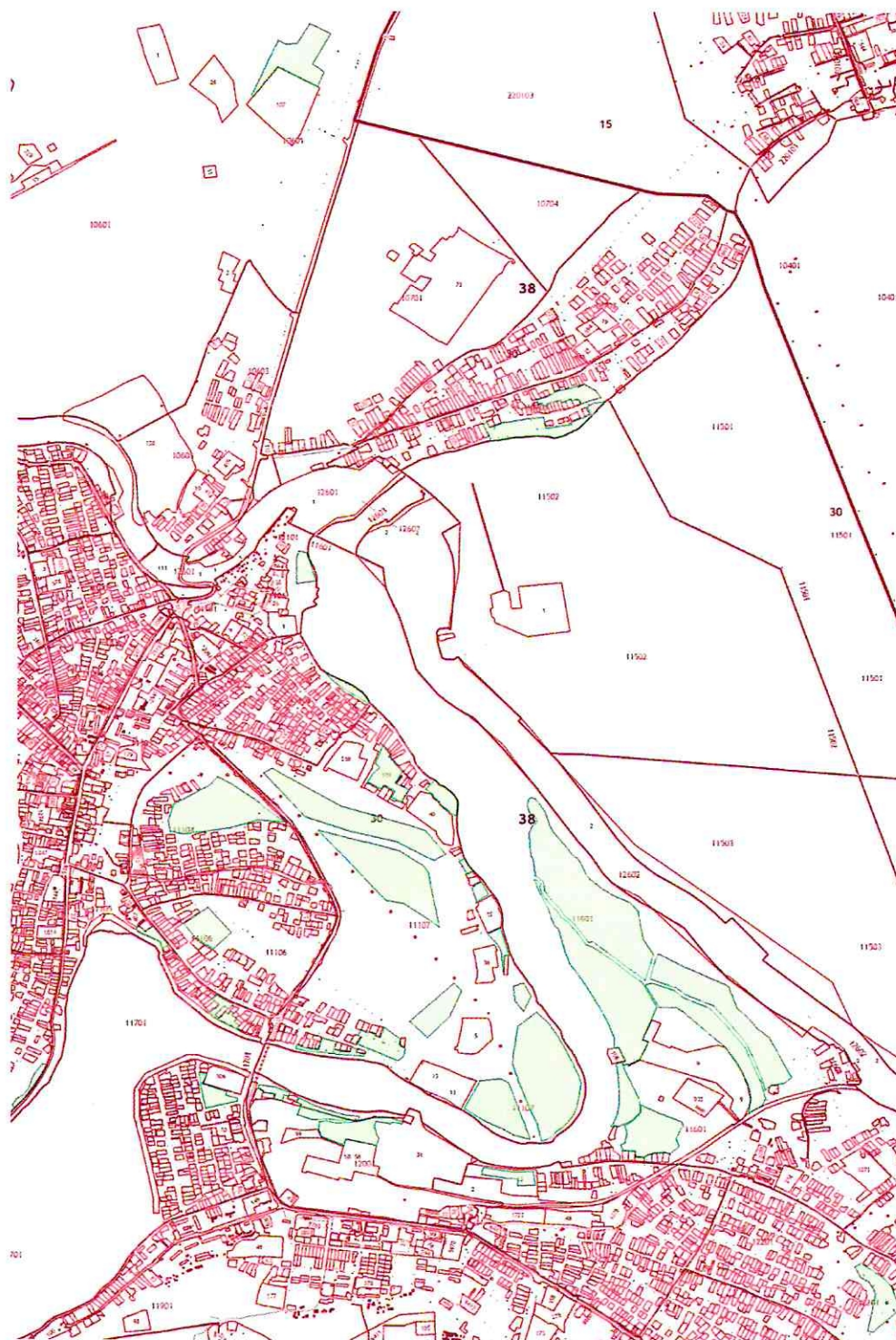
Схема расположения площадок для складирования грунта на кадастровом плане территории. Площадь земельного участка 1533568м 2